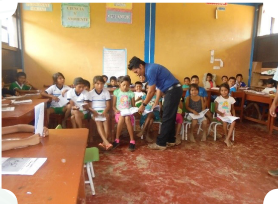
Imagen 1. Lecturas del cuento ambiental “Kawarita”, el pez que no debió morir.