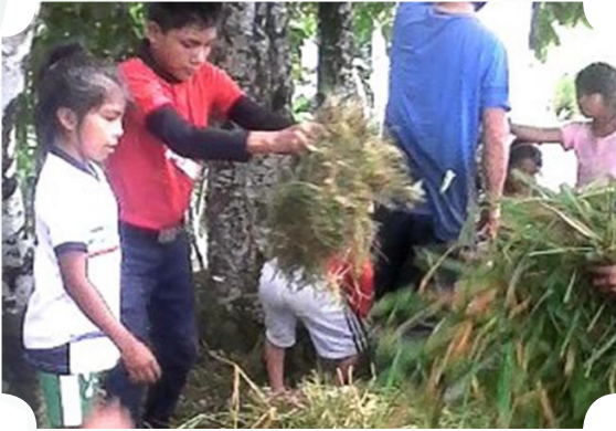
Imagen 4. Elaboración de canastas ancestrales para usar como tachos de residuos sólidos.