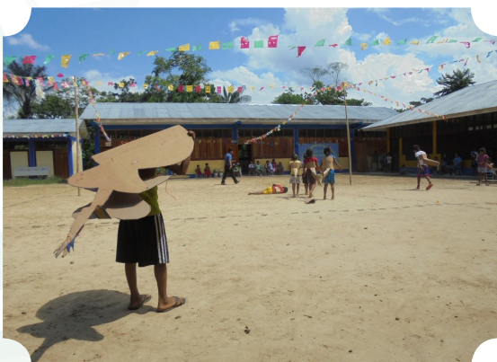
Imagen 2. Teatralización del cuento ambiental “Kawarita”, el pez que no debió morir.