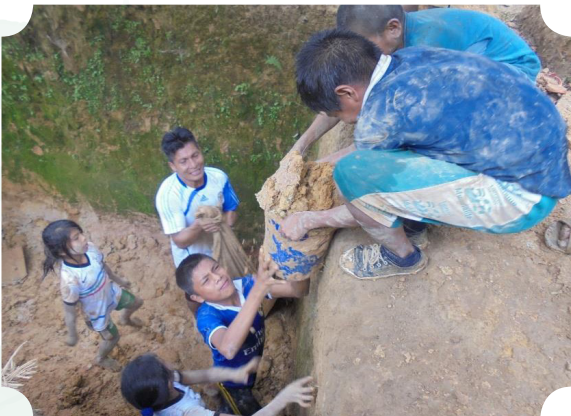
Imagen 6. Faena de elaboración de minirelleno sanitario de la I.E.