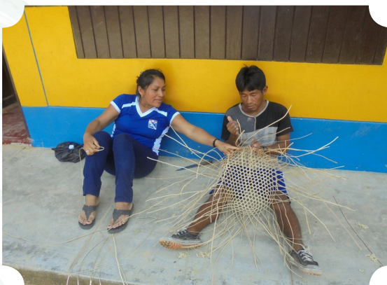
Imagen 3. Elaboración de canastas ancestrales para usar como tachos de residuos sólidos.