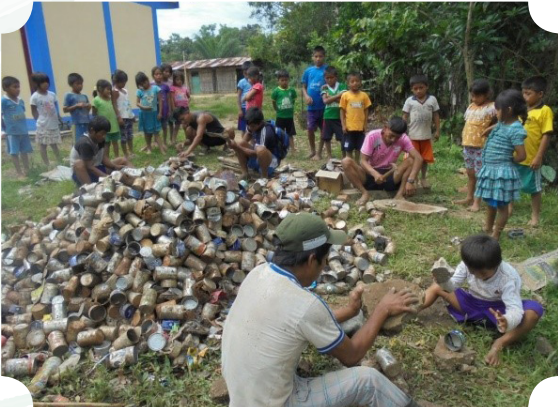
Imagen 5. Faena de recojo de residuos sólidos del monte junto a la I.E.