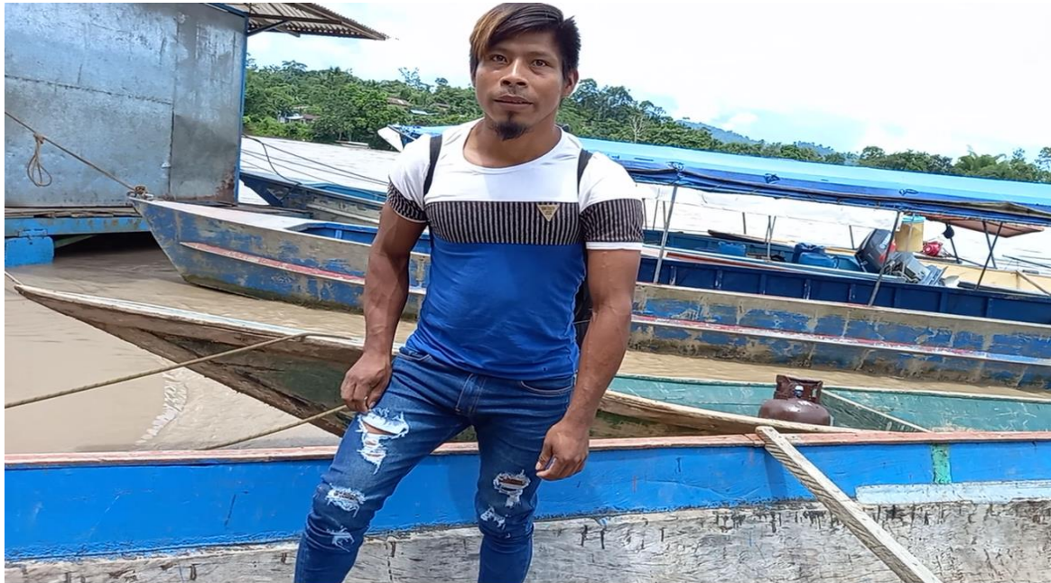
Figura 2 . Joven awajún migrando a las ciudades de la costa en busca de una oportunidad de trabajo