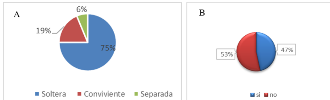
Figura 1. Características sociodemográficas; Estado civil (A); Peleas entre parejas en el distrito (B).

El 73% de las mujeres considera que las violaciones sexuales están mal. Un 27% que está muy mal (Figura 2 A). El 60% de las mujeres no conoce sobre denuncias de violaciones sexuales en el distrito, mientras que un 40% sí conoce algún caso. Esto podría indicar un bajo nivel de denuncia o de conocimiento sobre los casos que ocurren (Figura 2B).