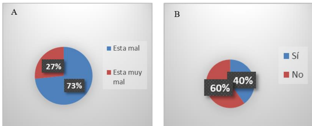
Figura 2. Percepción respecto a las violaciones sexuales; Opinión a las violaciones sexuales (2A); conocimiento respecto a las denuncias de violaciones sexuales (2B).

El 73% de las mujeres considera que las violaciones sexuales están mal. Un 27% que está muy mal (Figura 2 A). El 60% de las mujeres no conoce sobre denuncias de violaciones sexuales en el distrito, mientras que un 40% sí conoce algún caso. Esto podría indicar un bajo nivel de denuncia o de conocimiento sobre los casos que ocurren (Figura 2B).